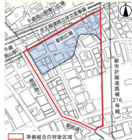
■第一種市街地再開発事業における建築計画

私が議会で求めて設置された「ちとからまちづくりフォーラム」では、地権者や住民との意見交換が行われてきましたが、「タワマンはいらない」との反対意見が多く出されています。